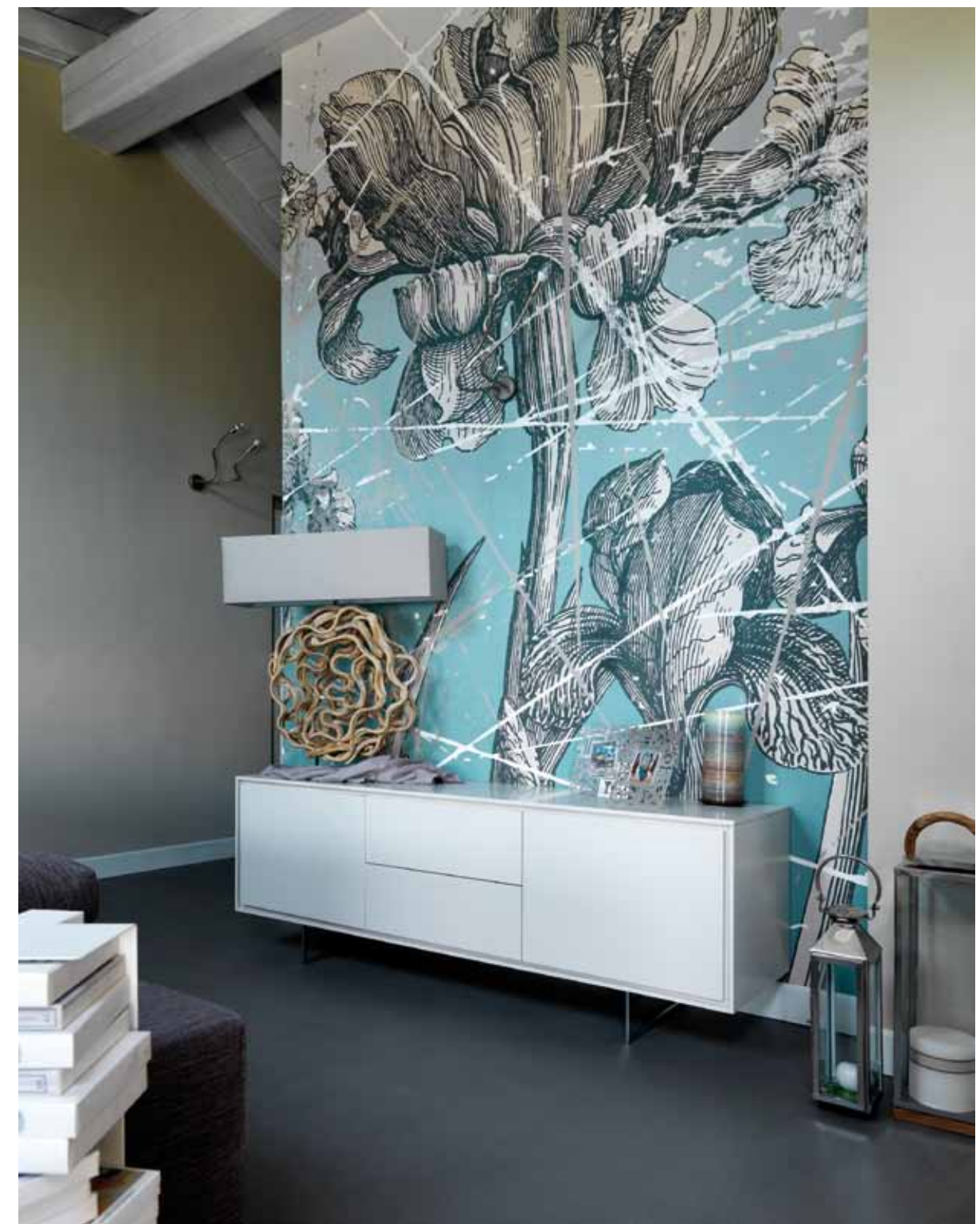
A sinistra: vista d'insieme della zona giorno dove risalta il contrasto tra il pavimento in resina di cemento ed il tetto ligneo sbiancato, che fanno da cornice ad un arredamento moderno e funzionale (Turra Arredamenti).