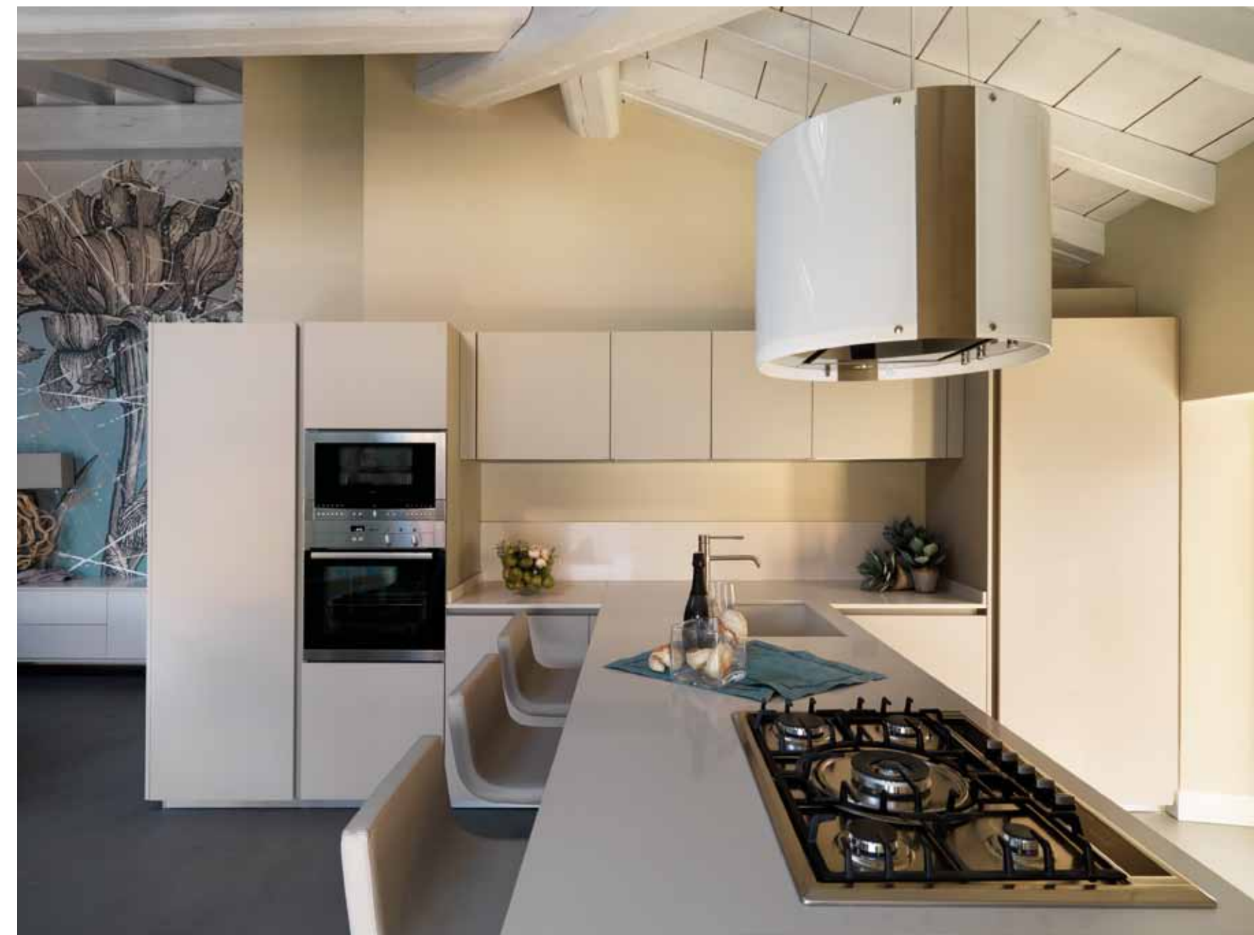
A sinistra: per il pranzo un tavolo rotondo in rovere laccato poro aperto bianco, allungabile fino ad ospitare quattordici persone, abbinato a sedie imbottite rivestite in pelle grigia con bordo bianco a contrasto; sospensione Skygarden di Flos (Turra Arredamenti). Sopra: la cucina, pensata in termini di capienza e fruibilità, presenta colonne che "nascondono" elementi tecnici e dettano una linearità ricercata, con i pensili che fanno da cornice alla zona operativa, dove una penisola attrezzata ospita lavaggio, cottura ed elettrodomestici, oltre a un'area snack con sgabelli imbottiti e rivestiti in pelle color sabbia; il piano è realizzato in agglomerato sabbia, usato anche per schienale e lavello in coerente uniformità; completa la composizione una cappa cilindrica in vetro laccato bianco (Turra Arredamenti).