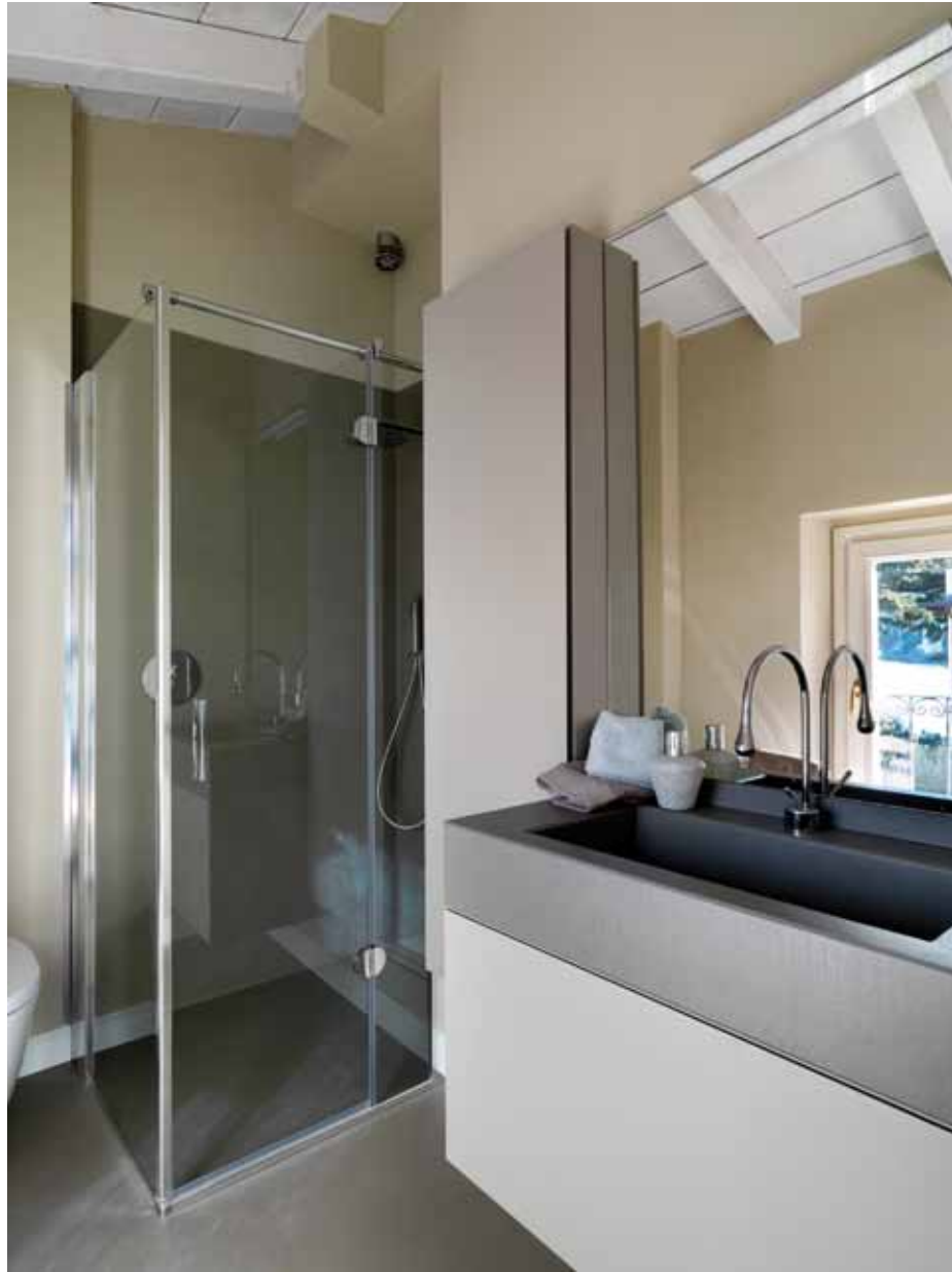
Bagno padronale completamente realizzato in resina di cemento nelle colorazioni grigio-tortora e sabbia, dove protagonista è l'ampia doccia creata in nicchia con piatto a filo pavimento eseguito in opera; il mobile bagno è contenitivo, laccato opaco; il piano con lavabo sagomato è in resina di cemento (Turra Arredamenti).