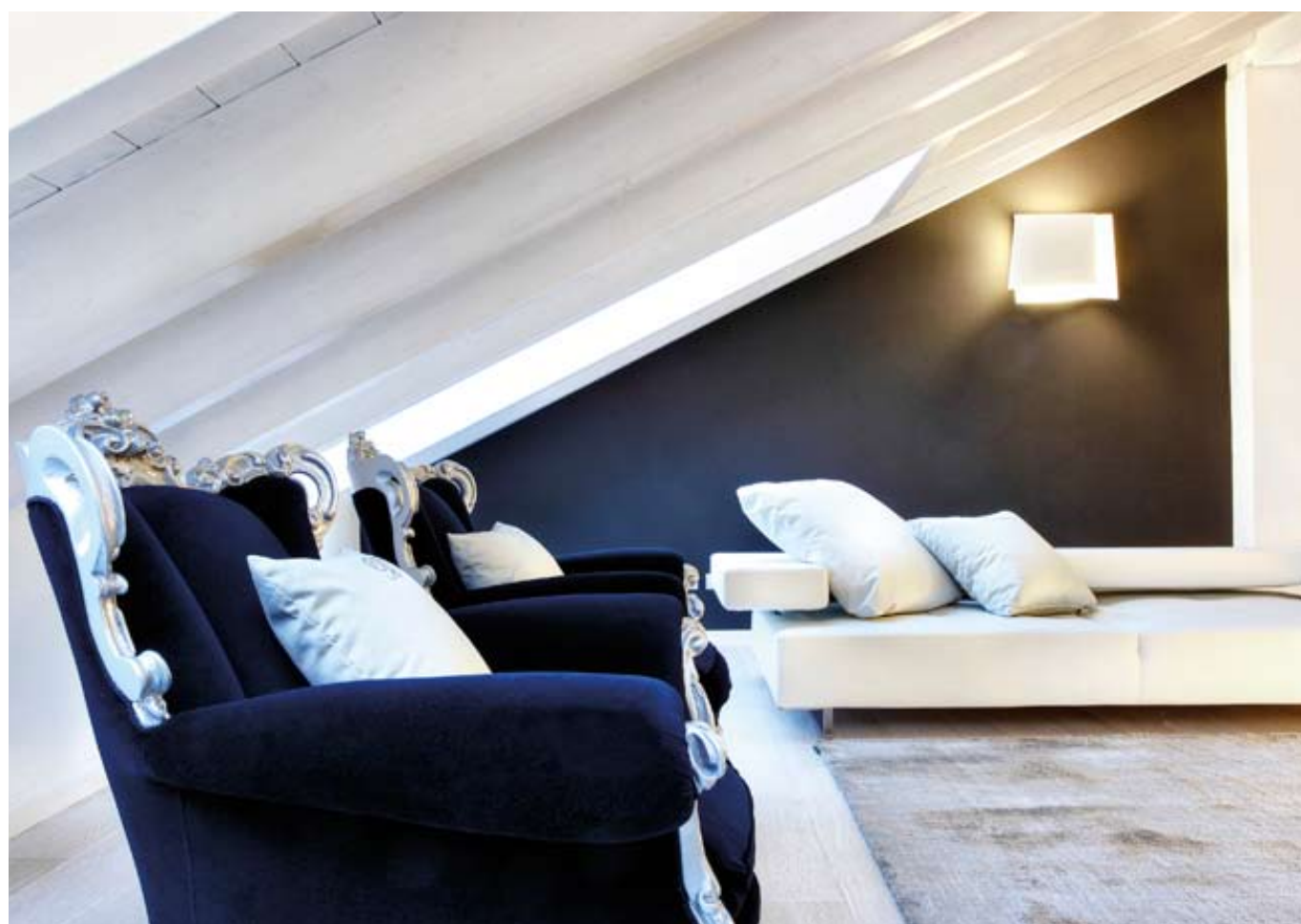
Particolari del soggiorno che accoglie il visitatore all'ingresso. Divani in pelle dal design moderno sono volutamente abbinati a poltrone che richiamano le antiche sedute alla francese, ironicamente reinterpretate in chiave moderna (Turra Arredamenti, Iseo-Bs).