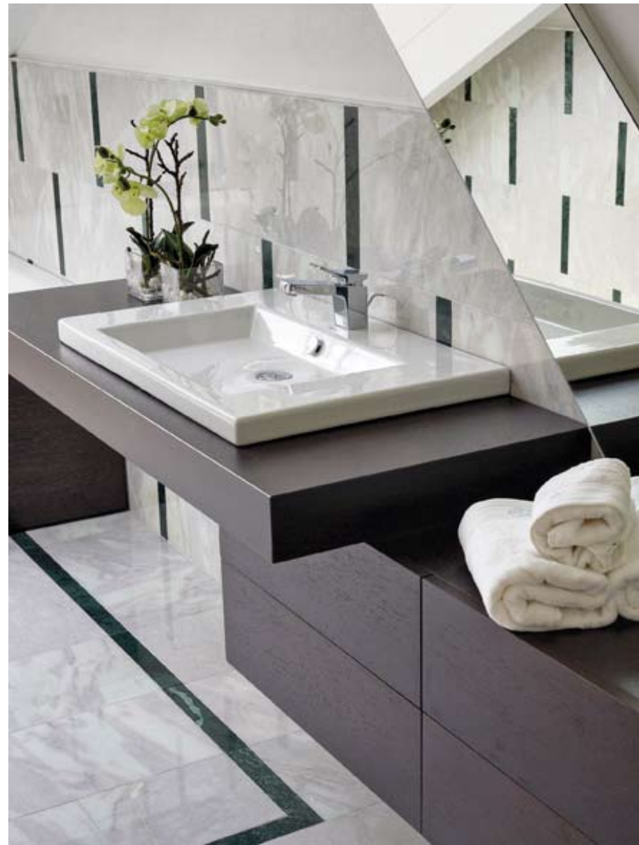
Sopra: mobile bagno realizzato a misura con contenitori sospesi in wengè (Turra Arredamenti). Nella pagina accanto: letto con contenitore "Bluemoon" di poltrona Frau vestito con biancheria Blumarine (Turra Arredamenti).